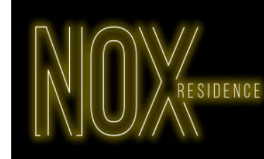
Tabela de Preços: BV 32 Vigência: out/23 Construção: ZELTA Construção e Incorporação S.A Endereço: RUA BOM JESUS N°962 Prazo de Entrega: 01/08/2021 Responsável Técnico: Eng. Rogério Muniz - CREA 33138 – Pr Alvará N°: 374183