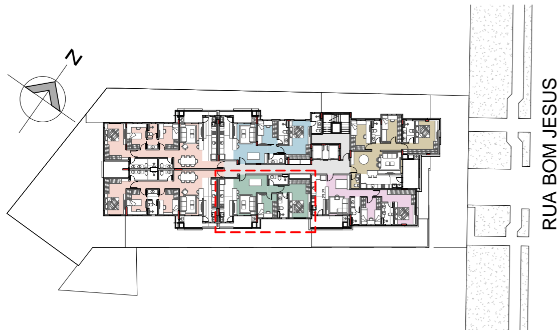
2 PAVIMENTO TIPO (2º e 3º) - UNIDADES 203 e 303 ESCALA 1 : 500