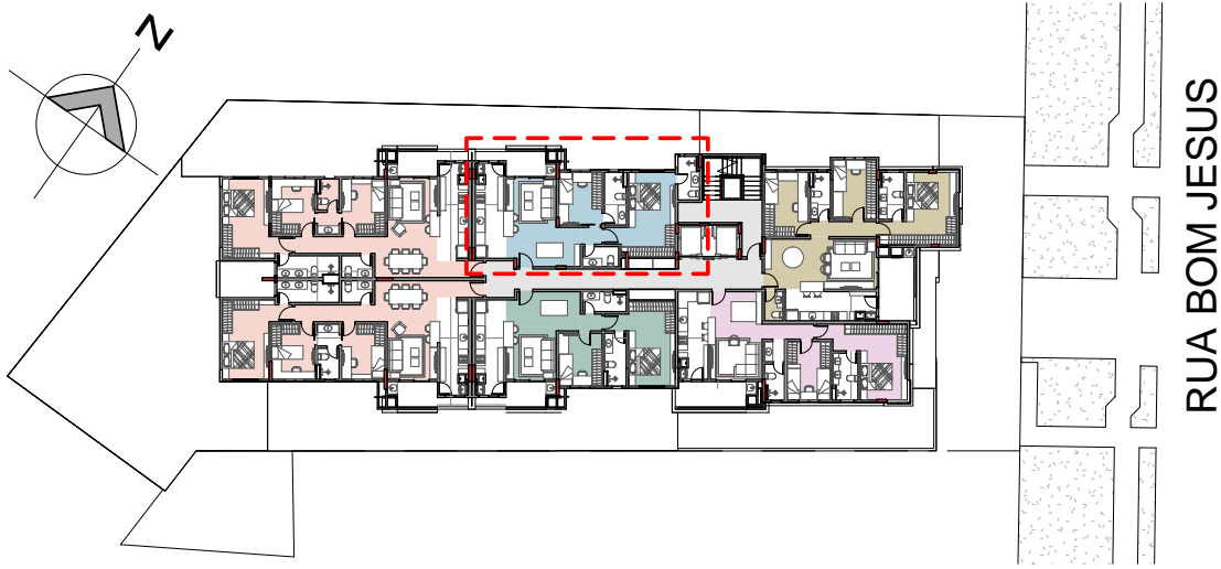
2 PAVIMENTO TIPO (2º e 3º) - UNIDADES 206 e 306 ESCALA 1 : 500