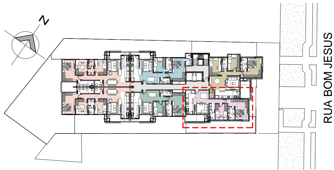
2 PAVIMENTO TIPO (2º e 3º) UNIDADES 202 e 302 ESCALA 1 : 500