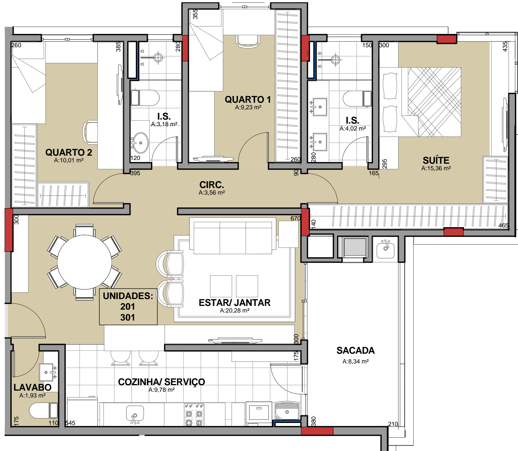
1 UNIDADES 201 e 301 ESCALA 1 : 50